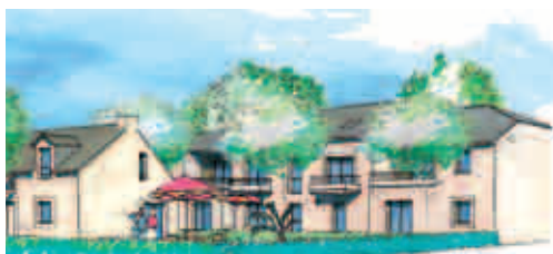
Sucé-sur-Erdre, Le Hameau des Jaunais, 2 logements individuels et 7 logements collectifs, architecte Cabinet Boisdron