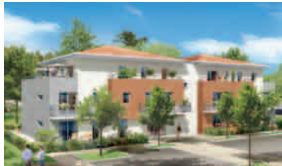
Le Loroux-Bottereau, Floriana 2, 37 logements collectifs, architecte Cabinet Quadra

Un engagement dans le plan de relance, en complément d'un volume d'activité soutenu :