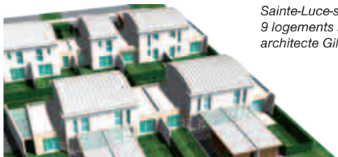
Sainte-Luce-sur-Loire, Coulée des Islettes, 9 logements individuels, architecte Gilles Béziau